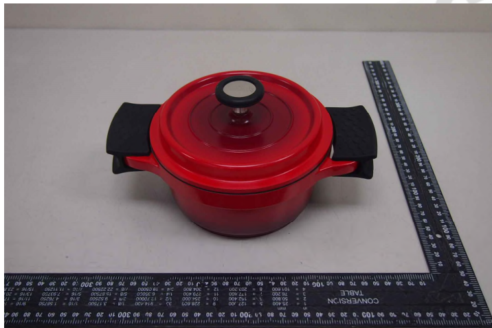
* 產品照片 *

產品名稱 : SSP-W16 膳魔師全能燉煮雙耳含蓋壓鑄湯鍋 16cm 產品型號 : SSP-W16 廠商名稱 : 皇冠金屬工業股份有限公司 廠商地址 : 台北市中山區復興南路一段 2 號 8 樓之 1 報告編號 : HTF22200010、HTF22200011、HTF22200014 核發日期 : 2022-02-16 有效日期 : 2024-02-16 引用標準 : 耐熱性試驗