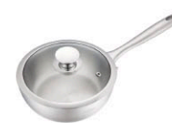
名家雪平鍋 KOF-W20 直徑：20 cm / 容量：2.0 L 定價：3,800元