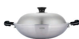
新一代複合金炒鍋 雙耳炒鍋 WK6-36-S 直徑：36 cm / 容量：6.0 L 定價：8,350元