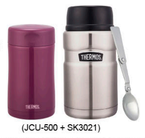
(JCU-500 + SK3021)

真空食物燜燒罐 500ml + 720ml (乙組) 原價 3,250 元 超值價 1,799 元