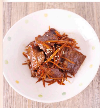
牛小排&牛蒡時雨煮 (4人份)