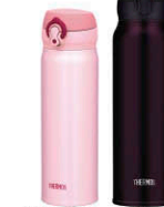
(JNL-500 + JNL-751)