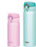
(JNL-350 + JNL-500)