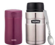
(JCU-500 + SK3021)