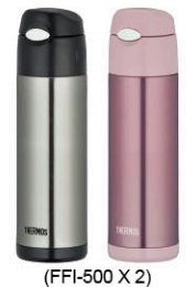
(FFI-500 X 2)

成人吸管式保冷瓶 500ml X 2支 (乙組) 原價 3,400 元 超值價 1,599 元