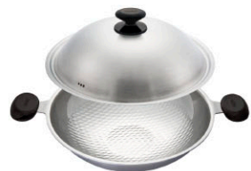
新一代享瘦鍋 雙耳炒鍋 WOK-36-S 直徑：36 cm / 容量：6.0 L 定價：9,800元