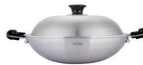
新一代複合金炒鍋 雙耳炒鍋 WK6-40-S 直徑：40 cm / 容量：8.0 L 定價：8,850元