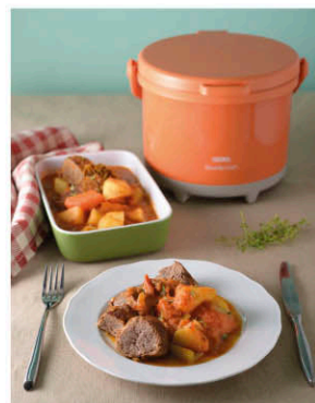
美式燉牛肉 詳細食譜請參考第14頁