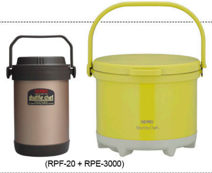
(RPF-20 + RPE-3000)

真空燜燒鍋組 真空燜燒提鍋 1.5L + 彩漾真空燜燒鍋 3.0L (乙組) 原價 10,950 元 超值價 5,999 元