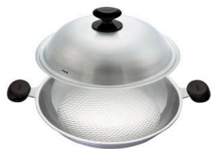
新一代享瘦鍋 雙耳炒鍋 WOK-40-S 直徑：40 cm / 容量：8.0 L 定價：10,500元