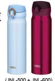
(JNL-500 + JNL-600)

極超輕真空保溫瓶 500ml + 600ml (乙組) 原價 3,300 元 超值價 1,699 元