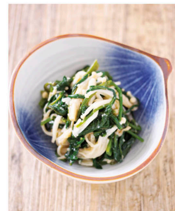
醋味噌涼拌青菜 & 金針菇 (2人份)