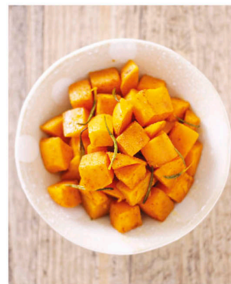
香煎金黃地瓜塊 (2人份)

我要介紹一道名字很特別的料理——「時雨煮」(Shigureni)，它是一種以醬油為基底，另外再加入薑一起煮的料理，吃起來有一點像壽喜燒，而且有薑的風味，因為這種味道很下飯，通常會用到許多牛肉片一起煮，所以學生們十分喜愛這道料理。這次介紹的時雨煮加入了牛蒡，也是時雨煮常會用到的食材，不但有肉的蛋白質，也有牛蒡的纖維，營養豐富，不只適合年輕人，上班族也可以享受。因為它具備了佃煮料理(保存食物)的要素，所以很適合將煮好的食物冷藏或冷凍起來，而且牛蒡解凍後，還可以留有脆脆的口感。應用的方式很多，裝在飯糰裡，放入玉子燒中間，或直接裝在白飯上做成丼飯都很好吃！配菜部分，我做了香草味的金黃色酥脆方塊地瓜，搭配牛肉料理非常棒，加上我個人很愛吃的白醋和味噌一起做的涼拌菜，微酸的味噌醬和蔬菜一起吃非常可口，當成下酒菜也很適合喔！