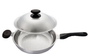
新一代享瘦鍋 單柄平底鍋 WOK-30HB-S 直徑：30 cm / 容量：4.0 L 定價：8,700元