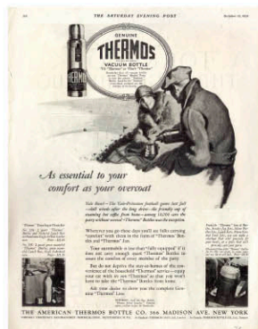
THERMOS® 1926年懷舊海報 THERMOS® 膳魔師無時無刻 溫暖陪伴你。

這道慢燉入味的「美式燉牛肉」非常適合以燜燒鍋製作，烹調簡便又有節能減碳及安全免看顧的良好效益。秋冬時節，不妨搭配應景又營養的根莖類蔬菜做上一鍋，替關愛的親人和朋友添點飽足與溫暖，為他們獻上最暖心的守候！Happy holidays!