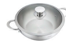
名家拌炒鍋 KOA-W30 直徑：30 cm / 容量：5.5 L 定價：6,100元