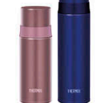
(FFM-350 + FFM-500)