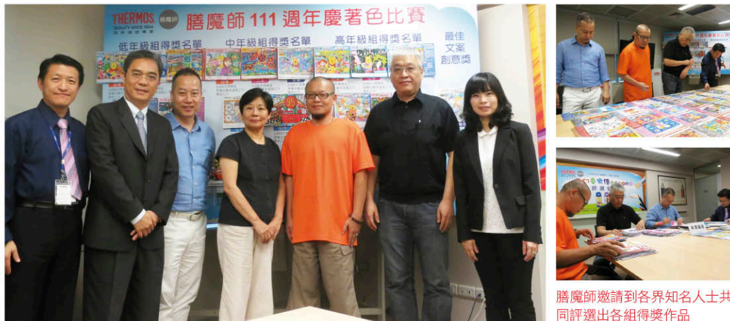
膳魔師邀請到各界知名人士共同評選出各組得獎作品

THERMOS 膳魔師致力於提倡環保愛地球，為了讓環保的觀念深植小朋友的心中，每年不斷推出各種小朋友喜愛的卡通授權商品，讓小朋友養成使用保溫瓶飲水的習慣並減少資源的浪費；同時，也在每年舉辦的著色比賽中推陳出新地提供了多款男生女生都愛的著色紙，讓小朋友揮灑創意，擁有色彩繽紛的暑假。