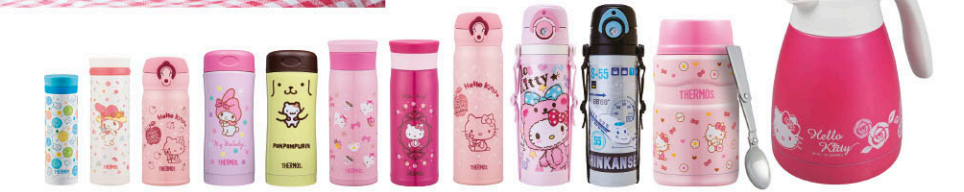
(JNC-300-BL(DRM) / JNO-350MM-WH / JNL-350KT-PCH / JCG-400MM-P / JCG-400PN-YL / JMZ-480KT-PK / JMZ-480KT-RK / JNL-500KT-PCH / FHH-500S(KT) / FHH-500S(S-S) / SK3021KT-BC / TGS-1000-PK)