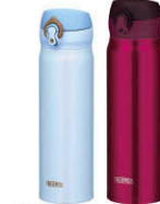
(JNL-500 + JNL-600)