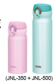
(JNL-350 + JNL-500)

極超輕真空保溫瓶 350ml + 500ml (乙組) 原價 3,050 元 超值價 1,599 元